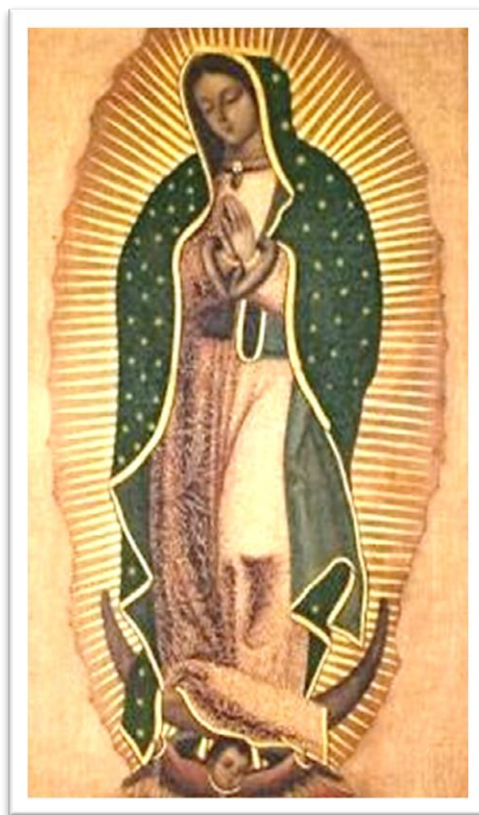
Imagen 2. Nuestra Señora de Guadalupe de El Carrizal Siglo XVIII