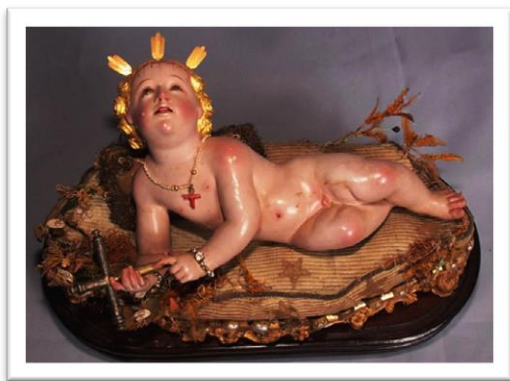
Figura 2. Escultura policromada del Divino Niño Jesús. Museo Arquidiocesano de Coro

Después de la santa misa cantada en honor al Divino Niño, la cofradía del mismo nombre que era dirigida por pardos se vestían con sus mejores uniformes de milicia, hacían su parada militar en la plaza principal de la ciudad, al son de tambores y trompetas y sacaban en procesión solemne a la imagen del niño Jesús presentado con base de plata adornadas de flores naturales.