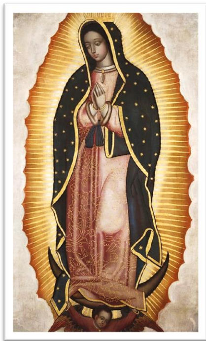
Imagen 3. Virgen de Guadalupe de Juan Correa Siglo XVIII

El lienzo de Nuestra Señora de Guadalupe que se venera en la Basílica Menor de El Carrizal guarda similitud con las obras guadalupanas coloniales de los famosos pintores Correa y Cabrera, y aunque es difícil determinar su autoría, se afirma que es una pintura mexicana del siglo XVIII.