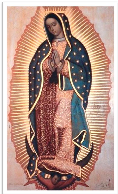
Imagen 1. Virgen de Guadalupe de Miguel Cabrera Siglo XVIII

A continuación, se realiza una comparación de pinturas coloniales que se le atribuyen a los pintores guadalupanos antes citados con el Lienzo que se venera en el Santuario de Nuestra Señora de Guadalupe de El Carrizal. No existe intención de afirmar de forma categórica que este último fuera pintado por alguno de ellos, por carecer de estudios más detallados y porque existieron muchos artistas que se dedicaron a pintar a la Virgen Morena. Sin embargo, debido a las similitudes de las fechas y las características artísticas similares que presentan, es posible acercarnos y determinar que provienen por lo menos, de la misma escuela.