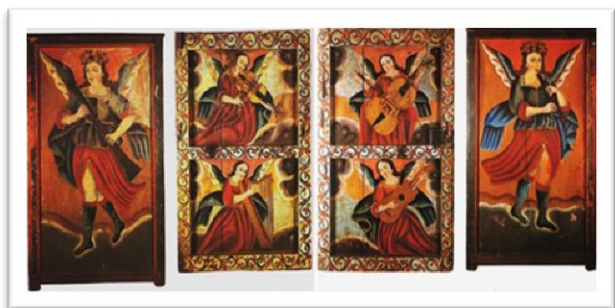
Figura 1. Armario de Ángeles tocando instrumentos musicales. Museo Arquidiocesano de Coro

El 24 día del nacimiento del Niño Dios, se celebraban con solemnidad los actos propios navideños con cantos sacros, músicas y danzas, donde los repiques de campanas anunciaban o marcaban el inicio del evento. Con previos ensayos los músicos tocaban los instrumentos tradicionales de la época (guitarra, oboe, flauta dulce, violín, arpa y violoncelo). Grupo de instrumentos musicales que se pueden apreciar en un mueble coriano de época donde unos arcángeles le tocan a un pesebre de madera (colección Museo Arquidiocesano de Coro).